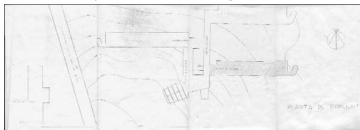
Imagen 3 Plata de conjunto de la Escuela de Ingeniería de Petróleos