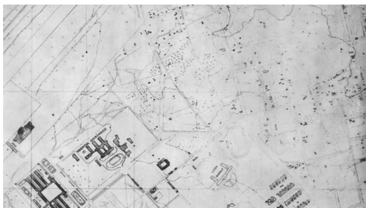
Imagen 1 Terrenos al noroeste de la ciudad de Maracaibo, donde quedaría ubicada la Escuela de Ingeniería de Petróleos de LUZ

Esta selección se debe a que Maracaibo, para 1950, “...se encontraba dividida en su traza en dos asentamientos urbanos separa-